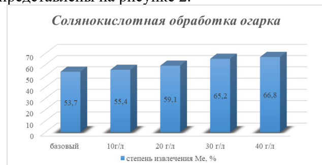
Рис.2. Диаграмма обработки огарка с применением HCl.

Для определения наиболее эффективного реагента для обработки огарков были проведены исследования с применением соляной кислоты. Для этого была использована та же проба материала и выполнена предварительная обработка перед цианированием раствором HCl в концентрациях от 10 до 40 г/л при тех же условиях процесса. Полученные результаты представлены на рисунке 2.