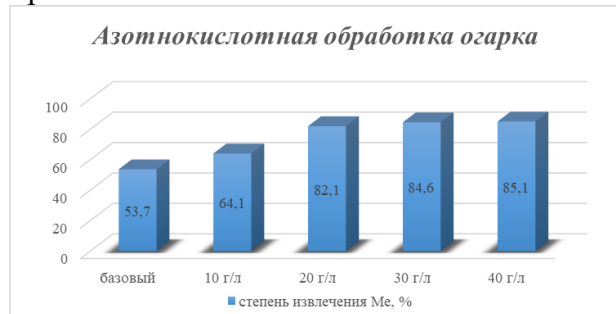
Рис.3. Диаграмма обработки огарка с применением HNO 3 .

Из диаграммы на рисунке 3 видно, что при использовании азотной кислоты степень извлечения серебра заметно повысилась по сравнению с другими реагентами. При концентрации 40 г/л получены наивысшие показатели, а степень извлечения металла по сравнению с базовыми значениями увеличилась на 31,4%. Данное значение является экономически рентабельным для обработки огарков.